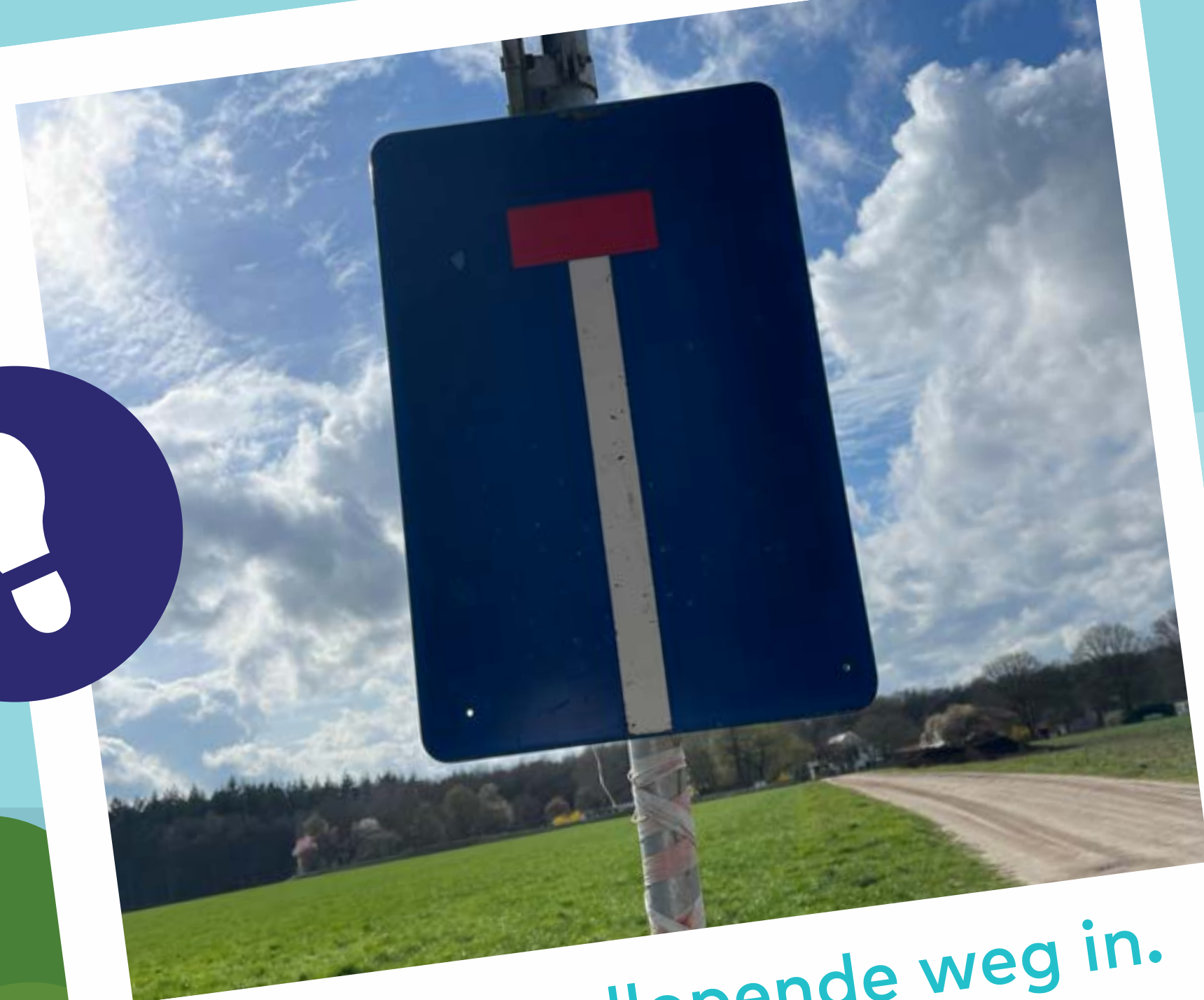
Loop de doodlopende weg in.