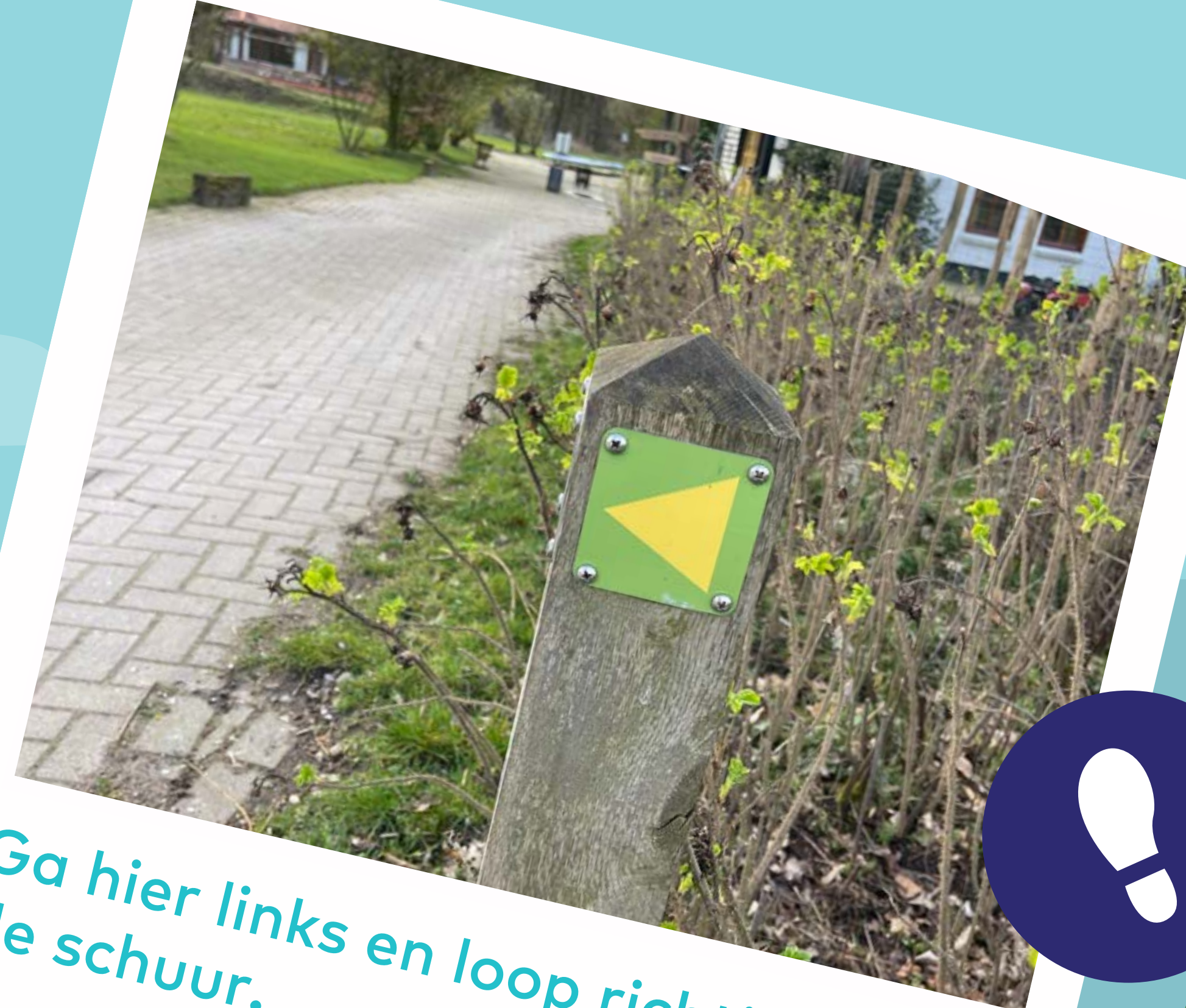
Ga hier links en loop richting de schuur.